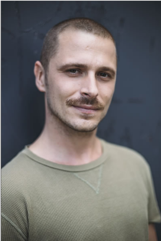
fotos: © Bild 1,2,3, 6 Sabine Costinel, Bild 4 Alice Ionescu, Bild 5 Lars Laion, 06/2018